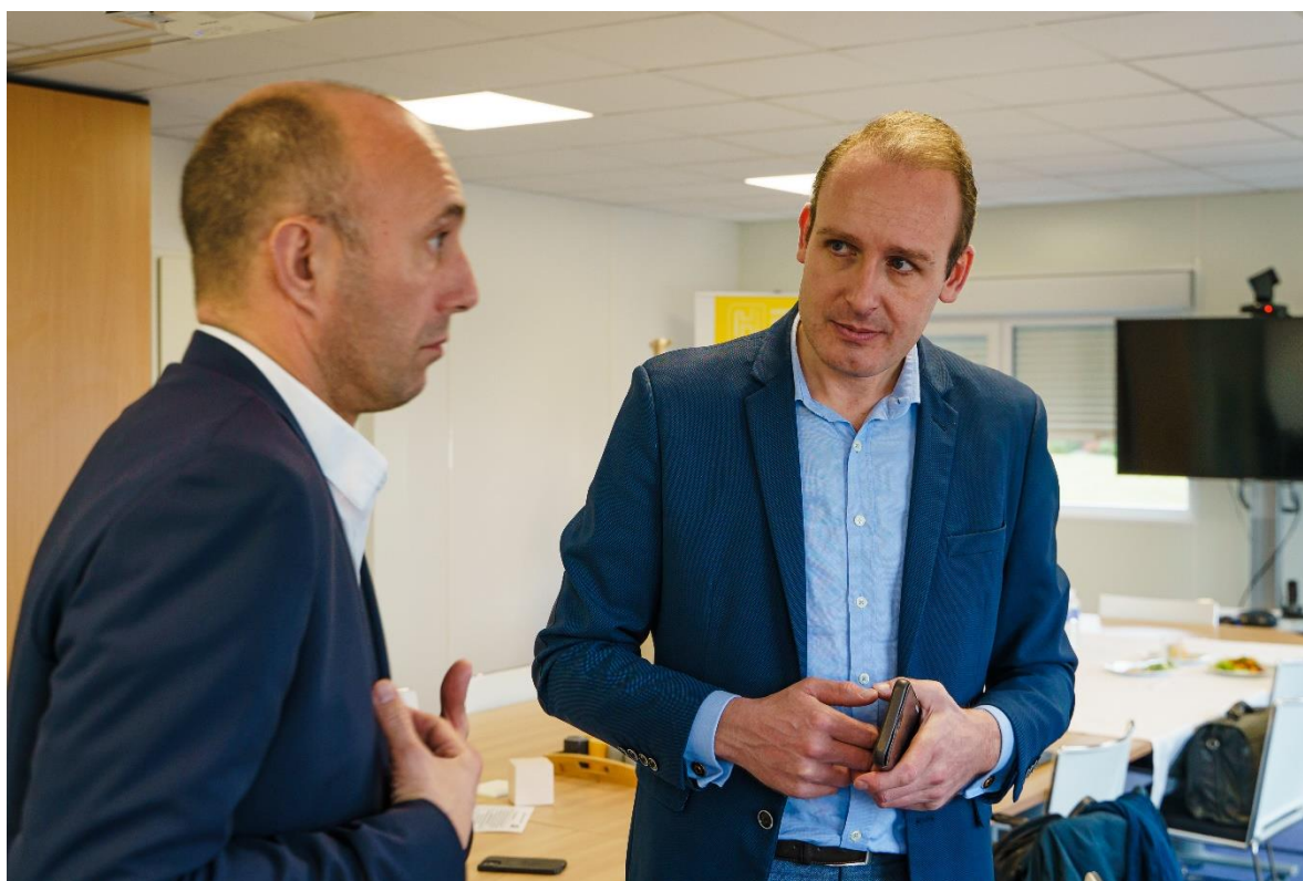
Les équipes de management de Belin promotion et d'Hoffmann Green Cement

Dès 2023 et pour les trois prochaines années, Hoffmann Green Cement fournira au groupe Belin promotion ses ciments décarbonés 0% clinker en vue de la construction de plusieurs logements collectifs et tertiaires. Actif au cœur du grand Sud-Ouest, à Toulouse, Bordeaux ou Bayonne, ce contrat permettra à Belin promotion de poursuivre ses engagements en matière de durabilité et ainsi répondre au bien-être des futurs résidents.