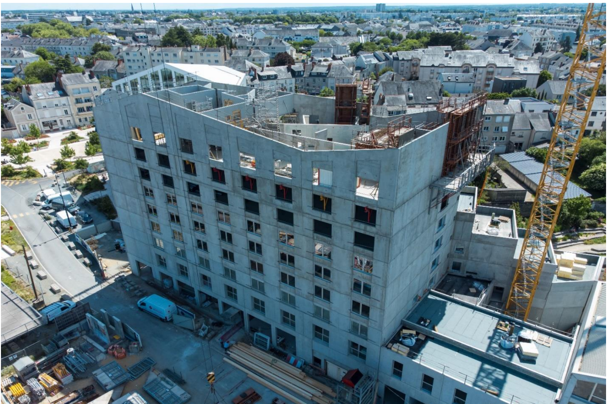
La résidence Skyline à Angers réalisée en béton sans clinker H-UKR

A l'issue de ces tests qui se sont révélés plus que concluants, les deux entreprises ont décidé d'accélérer leur collaboration avec la signature d'un contrat de partenariat avec engagements de volume qui inclut l'ensemble de la gamme des ciments de la Société : H-EVA, H-UKR et H-IONA. Hoffmann Green fournira dès cette année son béton décarboné 0% Clinker à Bouygues Immobilier dans le cadre de la réalisation de multiples chantiers d'envergure au niveau national.