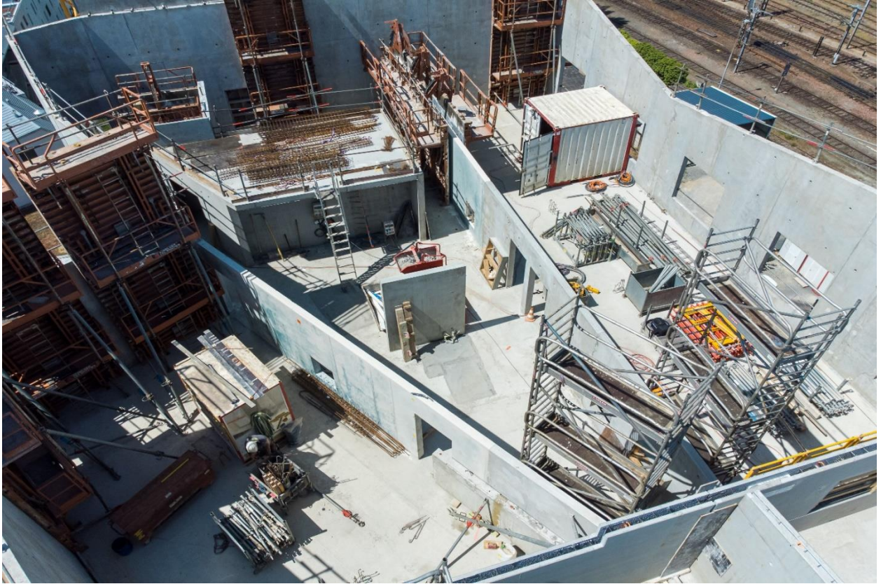
Coulage de béton décarboné HOFFMANN 0% Clinker sur le chantier SKYLINE à Angers