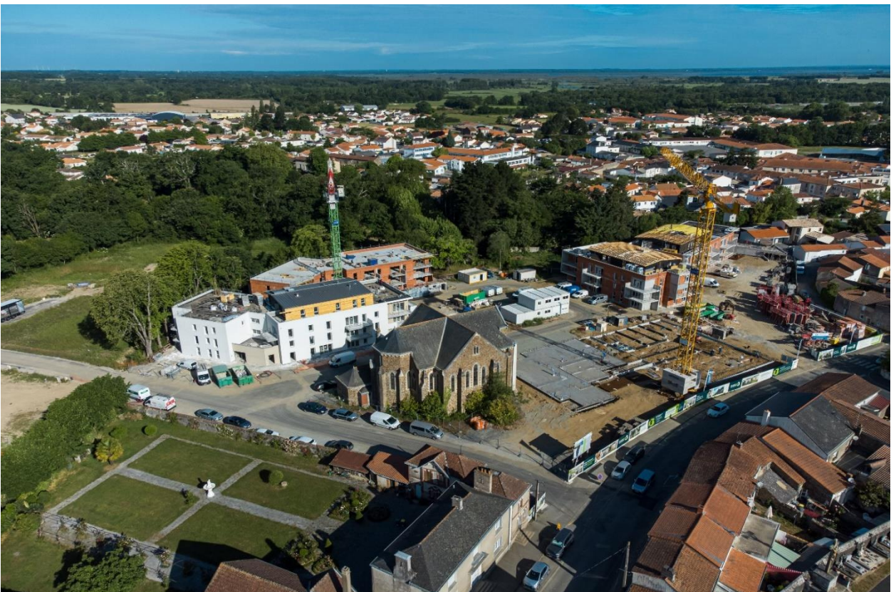
Vue drone du chantier le Clos Saint-François à Saint-Philibert de Grand Lieu