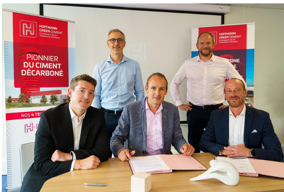
Les équipes de management de Hoffmann Green et de Cemblend

Dès ce second semestre 2022, Hoffmann Green fournira à Cemblend ses ciments décarbonés sans clinker H-IONA, H-UKR et H-EVA qui les distribuera à ses clients au Royaume Uni et en Irlande. Ce contrat de distribution exclusive avec engagement de volumes court initialement jusqu'à fin 2023 et constitue une première étape vers la signature d'un contrat de licence qui pourrait voir Cemblend construire et exploiter une unité de production similaire au deuxième site de production d'Hoffmann Green (H2), puis produire et commercialiser les ciments Hoffmann au Royaume Uni.